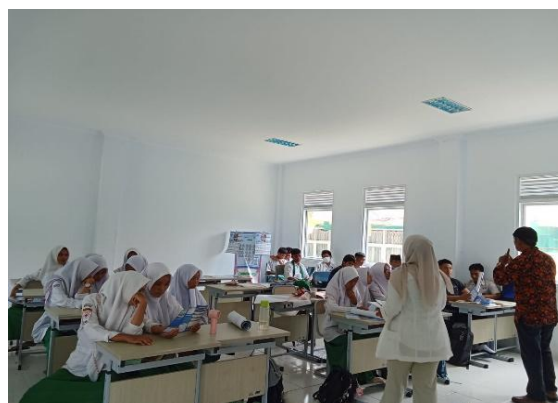
Gambar 2. Diskusi Interaktif

melalui penyebaran kuesioner dan analisis hasil observasi untuk menilai tingkat pemahaman dan respons peserta. Data yang diperoleh kemudian dianalisis secara deskriptif untuk menggambarkan efektivitas kegiatan dalam meningkatkan pemahaman siswa mengenai bisnis digital dan aspek hukum bisnis.