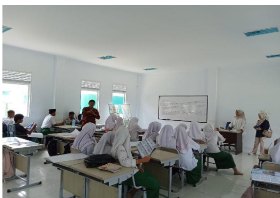
Gambar 1. Pemaparan Materi PKM

beralamat di Jl. MAN Kelurahan Pasar Atas Bangko, Sungai Kapas, Kecamatan Bangko, Kabupaten Merangin, Provinsi Jambi. Ruang lingkup kegiatan difokuskan pada pengenalan konsep bisnis digital, pemanfaatan teknologi digital sebagai sarana pendukung kegiatan usaha, serta pemahaman mengenai aspek hukum bisnis, termasuk pentingnya legalitas dan etika dalam menjalankan usaha. Sarana pendukung kegiatan meliputi laptop, proyektor, dan bahan presentasi dalam bentuk slide untuk menunjang penyampaian materi secara efektif.